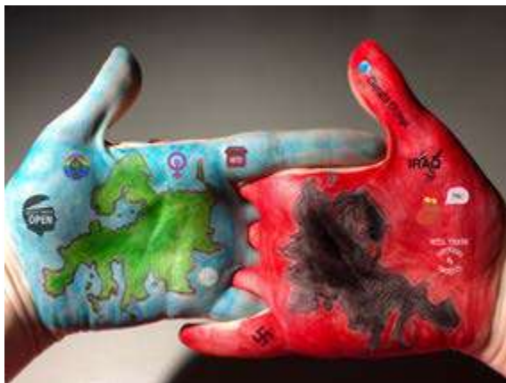
Foto guanyadora en la categoria de millor idea original: "Europes" de Júlia Domene