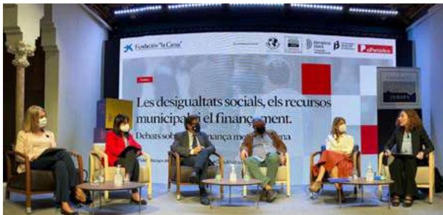
Taula rodona de la segona part de la jornada

Jornada organitzada el 13 d'octubre junt amb el PEMB i Club de Roma, que es va dividir en dues taules amb la participació de personal tècnic, acadèmic i alcaldes i alcaldesses de la regió metropolitana.