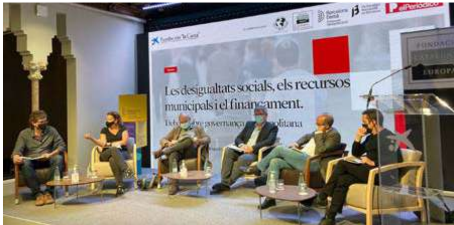
Taula rodona de la primera part de la jornada